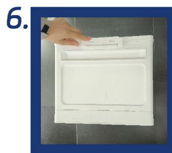
6. Pro dokončení montáže upevnite rukoväťe na oboch stranách.